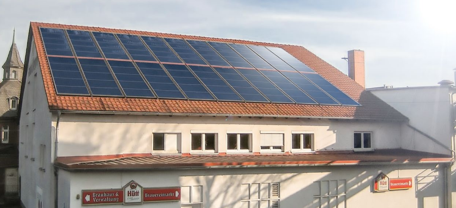
Flachkollektoren auf dem Dach der Hütt-Brauerei in Baunatal. Hütt nutzt eine solar thermische Anlage zur Vorerwärmung des Brauwassers.