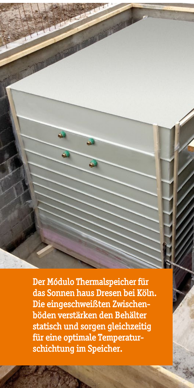
Der Módulo Thermalspeicher für das Sonnen haus Dresen bei Köln. Die eingeschweißten Zwischenböden verstärken den Behälter statisch und sorgen gleichzeitig für eine optimale Temperaturschichtung im Speicher.